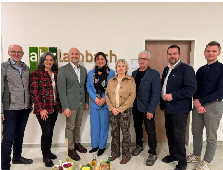
Mitglieder der neu gewählten GÖD-Landesleitung 27 Oberösterreich und Ehrengäste: v.l.n.r.