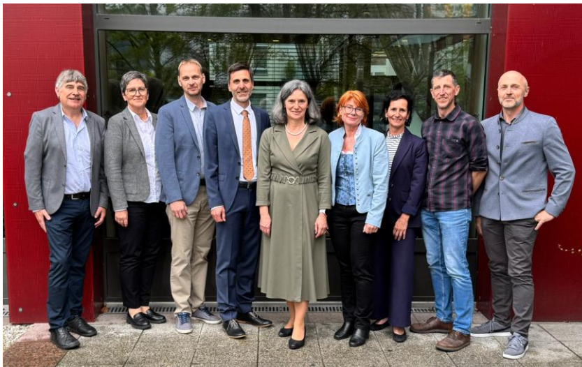
Die neu gewählte GÖD - Bundesleitung 27 – Landwirtschaftslehrer:innen